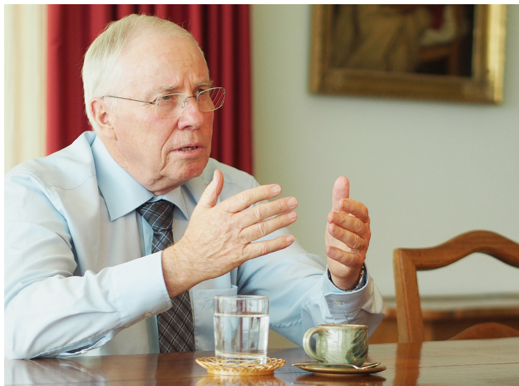
Christoph Blocher: La Suisse est aujourd'hui en meilleure position que les pays membres de l'UE

Si, mais uniquement dans les domaines où c'est utile et où il y a des intérêts communs. L'accord-cadre serait la fin de la voie bilatérale parce qu'il donne tous les droits à une seule partie – donc à l'UE. Mais nous autres Suisses, nous refusons de nous soumettre au diktat de Bruxelles.